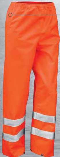
FLUORESCENT ORANGE (811)

Elasticated waist with drawcord adjuster