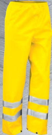
FLUORESCENT YELLOW (394)

GENEROUS SIZE ALLOWING TO BE WORN AS AN OVER GARMENT