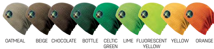
OATMEAL BEIGE CHOCOLATE BOTTLE CELTIC GREEN LIME FLUORESCENT YELLOW YELLOW ORANGE

100% Polyacryl Doppellagig Modisch-lange Form Sehr weich Sehr leicht Zum Veredeln geeignet Aus dem CORE Sortiment Einheitsgröße (19.5 x 30cm) Packinhalt 25 - Kartonhalt 150